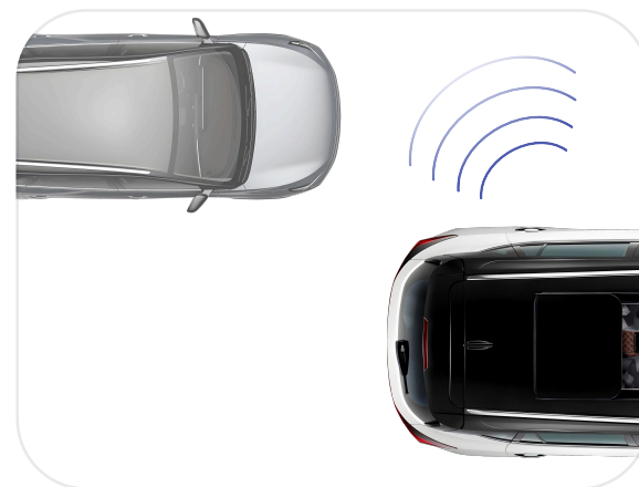
Система предупреждения об опасности открытия двери (DOW)