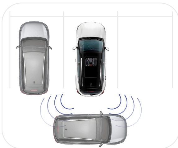
Система помощи при выезде задним ходом (RCTA)