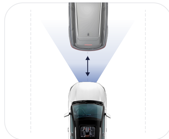
Адаптивный круиз-контроль (ACC)