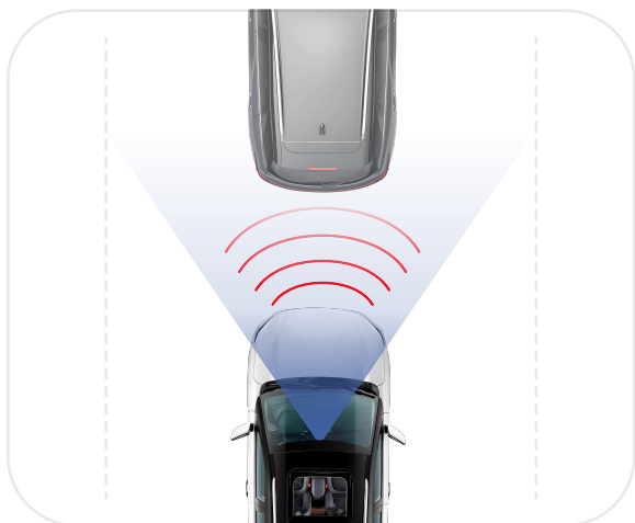
Система автоматического экстренного торможения (АЕВ)